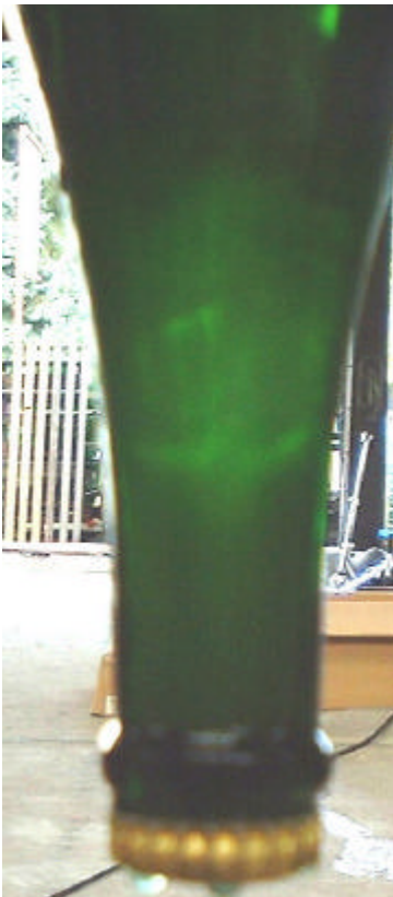
Hefe Bei minus 30 Grad vereist

Wir haben vier Sorten Sekt auf Lager. Alle werden nach der Methode der Champagne hergestellt.